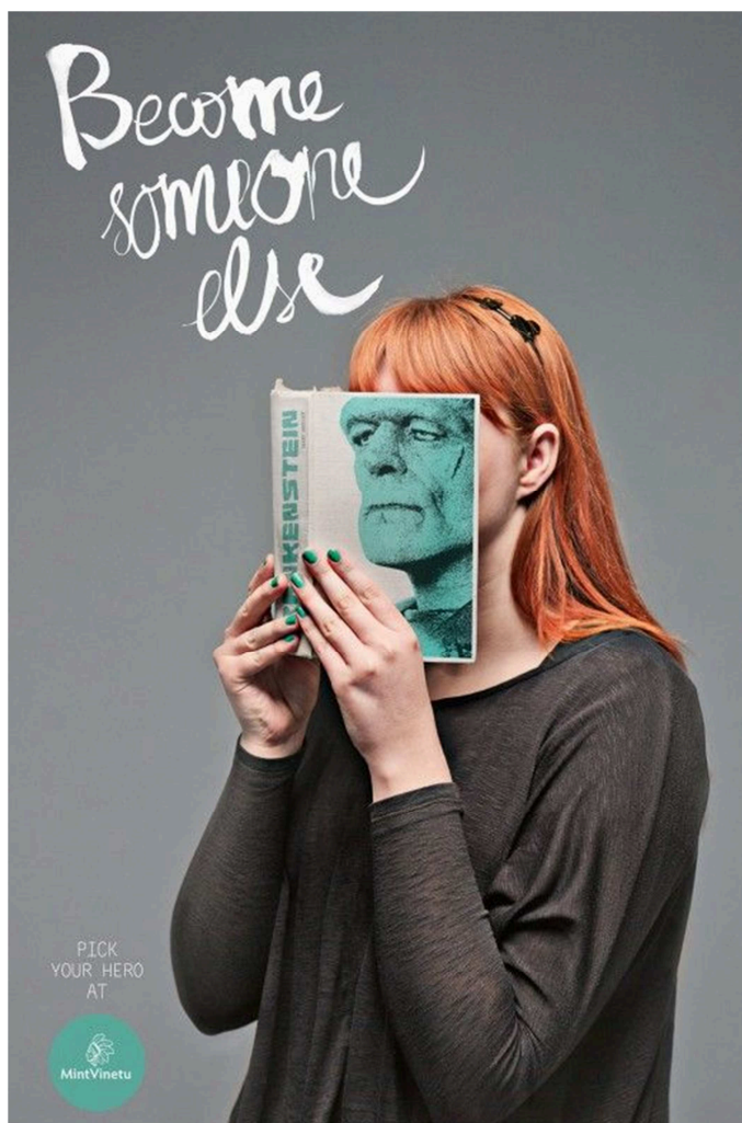
El logo MintVinetu és d'una llibreria de Lituània.